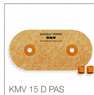
KMV 15 D PAS