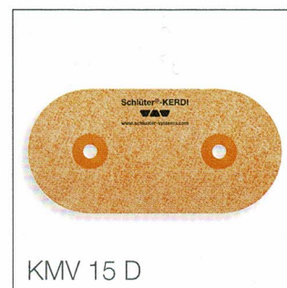
KMV 15 D