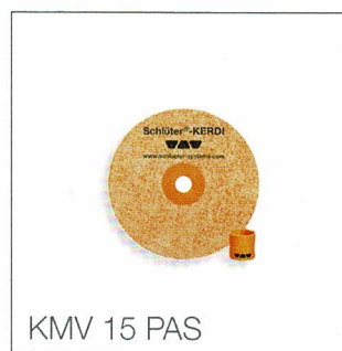
KMV 15 PAS