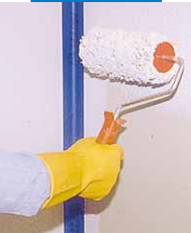
Plaatsing van een speciaal stuk Mapeband op Mapegum WPS