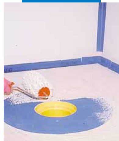
Aanbrengen van lijm op Mapegum WPS