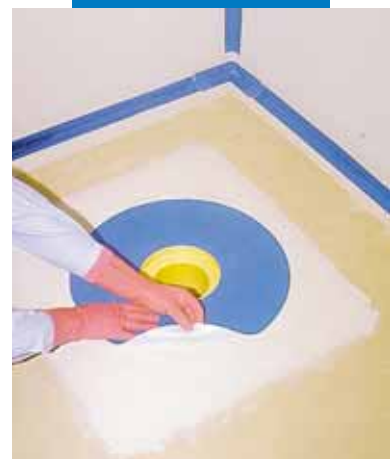
Met een kwast aanbrengen van Mapegum WPS

Het verbruik van Mapegum WPS bedraagt ongeveer 1,5 kg/ m 2 per mm laagdikte.