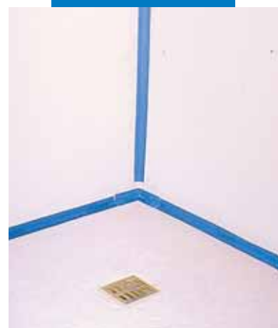
Aanbrengen van glasmazaïek