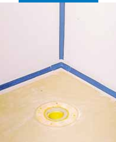
Het speciale stuk Mapeband wordt in Mapegum WPS weggewerkt