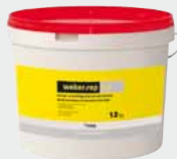
Montage- en herstellingsmortel met snelle afbinding